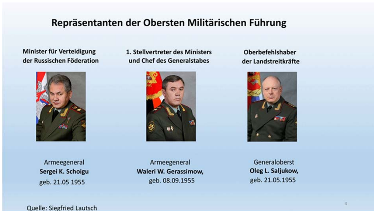
Abbildung 4: Repräsentanten der obersten Streitkräfteführung der Russischen Föderation.